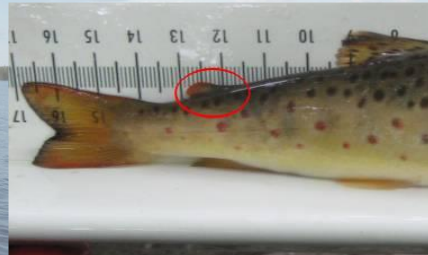
Rasvaevällinen taimen (luonnonkala)