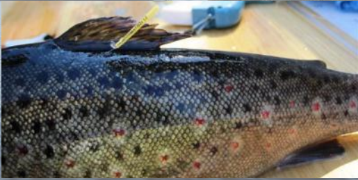
Ankkurimerkillä merkitty taimen

Päijänteen vesistöissä merkitään taimenia T-ankkurimerkein. Merkinnoilla seurataan taimenten vaellusta ja kannan tilaa. Merkitä kirjoitetaan ylös koodi. Liitä koodin tiedot, kuten pyyntipaikka, paino ja pituus. Koodit voi lähettää postimaksutta osoitteeseen: LUKE, Merki, 5005751, 00003 VASTAUSLÄHETYS Lisäohjeita saat internetistä osoitteesta https://lomakkeet.luke.fi/kalamerkki