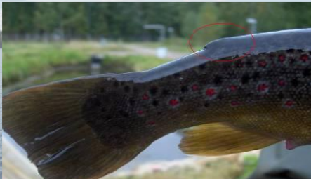
Eväleikattu taimen (istukas)

Vuoden 2016 alusta on rasvaevällinen taimen kalastusasetuksella rauhoitettu leveyspiirin 64 eteläpuolella. Sääntö koskee siis myös Päijänteen vesistöä.